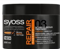
MÁSCARA INTENSIVA SYOSS REPAIR THERAPY (200ml) Repara intensivamente os danos existentes no interior das células do cabelo para até 95% menos quebra e nutrição intensa P.V.P recomendado: 6.39€ *

* valor sujeito a modificações de acordo com o livre critério do ponto de venda.