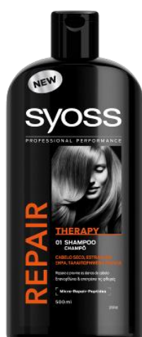
CHAMPÔ SYOSS REPAIR THERAPY (500ml) Reconstrução profunda e até 90% menos quebra** P.V.P recomendado: 6.39€ *